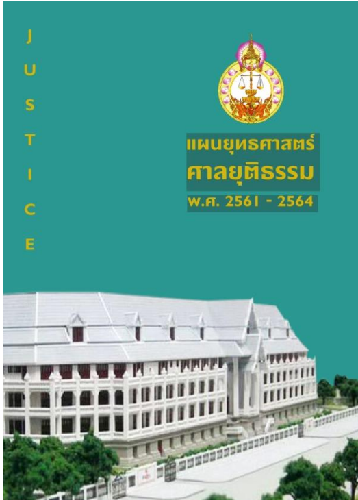
แผนยุทธศาสตร์ศาลยุติธรรม พ.ศ. 2561 - 2564