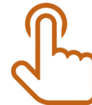
ความก้าวหน้าในการขับเคลื่อนแผนยุทธศาสตร์ ศาลยุติธรรม ประจำปีงบประมาณ พ.ศ. 2561