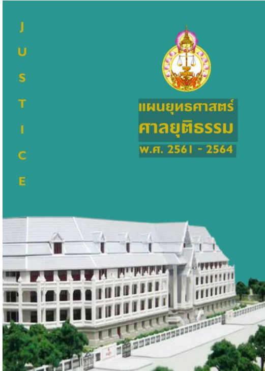
แผนยุทธศาสตร์ศาลยุติธรรม พ.ศ. 2561 - 2564